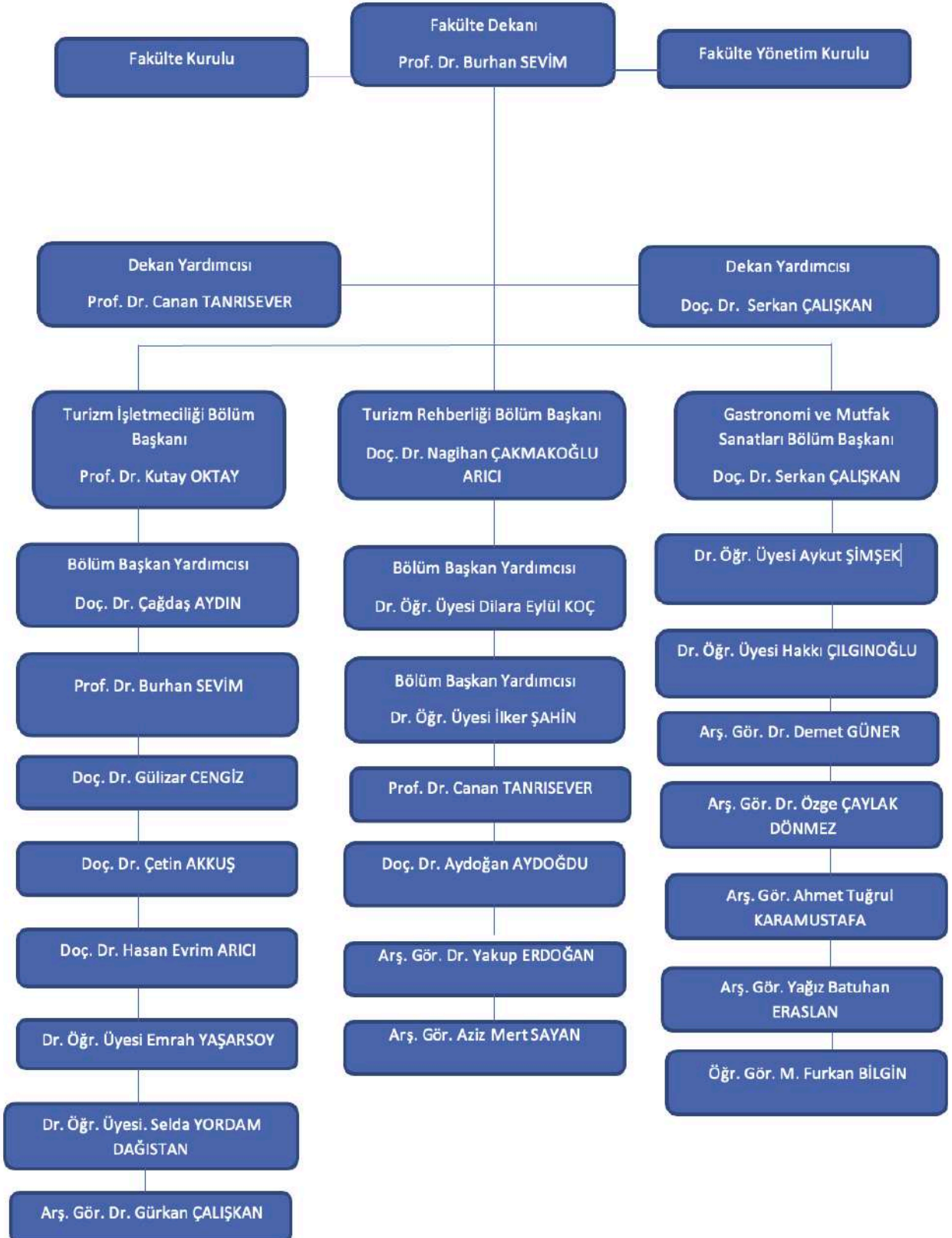
Şekil 1. Fakültemiz Organizasyon Şeması

Fakültemiz bünyesinde 3 profesör, 6 doçent, 6 doktor öğretim üyesi, 3 araştırma görevlisi doktor, 3 araştırma görevlisi ve 1 öğretim görevlisi görev yapmaktadır.